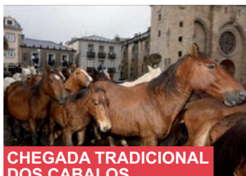
CHEGADA TRADICIONAL DOS CABALOS 17 outubro - 18,45 h. Praza da Catedral

A comisión de "As San Lucas 2018" agradece a súa colaboración e deséxalles ¡Boas Feiras e Festas!